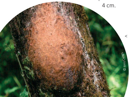
< Gespinst des Eichenprozessionsspinners

Zahl und Länge der Brennhaare nehmen mit jeder Häutung zu. Bis zum Ende des sechsten Larvenstadiums erreichen die Raupen eine Körperlänge von bis zu 4 cm.