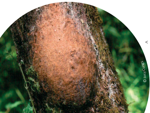
< nid de la processionnaire du chêne

La chenille se développe en automne et passe tout l'hiver dans l'œuf. En début de la période de végétation (fin avril, début mai), les chenilles éclosent. Elles passent alors par 6 stades de développement pour arriver à la nymphe. Dès le début, les chenilles sont très poilues, elles ont d'abord une coloration brun-jaune qui deviendra par la suite noir-bleuâtre. Sur 8 segments de l'abdomen, la chenille porte des zones constituées de poils soyeux de couleur brun-rouge, appelées miroirs. Sur ces derniers se trouvent à partir du 3 ème stade larvaire, des poils pourvus d'aiguillons urticants qui contiennent une toxine appelée thaumétopoéine. Le nombre, ainsi que la longueur de ses poils irritants augmentent avec chaque mue de la chenille. A la fin du 6 ème stade larvaire, la chenille peut atteindre une taille de 4 cm.